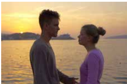
Romeo und Julia - eine ost-westliche Liebesgeschichte

Derzeit ist ein gemeinsamer Auftritt in den jeweiligen Heimatländern nicht möglich, so trafen sich die beiden Ensembles „MIR“ aus Deutschland und „PREMIER“ aus Russland im vergangenen Herbst in Izmir in der Türkei. In dieses Land können Deutsche und Russen visafrei einreisen. Die Türkei war einige Wochen nach dem Einmarsch der Russen in der Ukraine Schauplatz von Friedensverhandlungen.