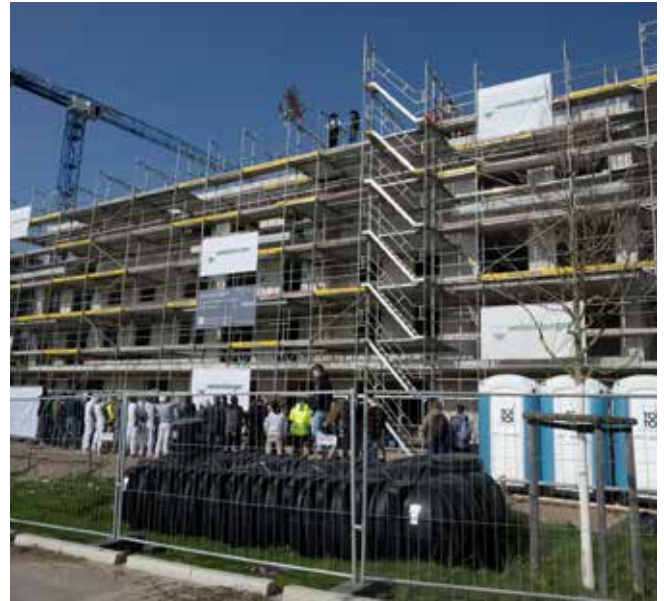
Der Rohbau des Mehrgenerationenhauses mit Kindertagesstätte im Baugebiet „Am langen Rain“ steht. Das 23 Millionen- Projekt wird voraussichtlich im Frühjahr 2025 fertiggestellt sein.

In dem von der KDF errichteten Gebäude entstehen 38 Wohnungen. Die Stadt Müllheim wird für die Hälfte dieser Wohnungen ein Belegungsrecht haben und dort einen erschwinglichen Mietpreis von zehn Euro anbieten können. Im Erdgeschoss des Südgebäudes entsteht darüber hinaus eine Kindertagesstätte mit fünf Gruppen, die vom Jugendhilfswerk Freiburg betrieben werden soll. Dort werden 80 bis 100 Kinder einen Betreuungsplatz finden. „Das reicht gerade für die Versorgung des neuen Wohngebietes aus, in dem am Ende rund 900 Menschen leben werden“, erklärte Müllheims Bürgermeister Martin Löffler.