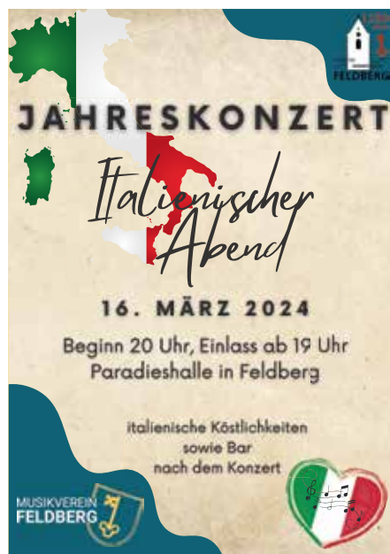
Konzert 2024

Kommenden Samstag, den 16.03.2024 um 20 Uhr veranstaltet der Musikverein Feldberg e.V. in der Paradieshalle sein diesjähriges Jahreskonzert unter dem Motto „Italienischer Abend“. Von traditionellen italienischen Melodien bis hin zu zeitgenössischen Stücken ist für jeden etwas dabei. Jedoch nicht nur die Musik lässt die „dolce vita“ nach Feldberg kommen - auch die italienischen Köstlichkeiten tragen dazu bei. Der Musikverein Feldberg e.V. freut sich auf Ihren Besuch. Eintritt frei.