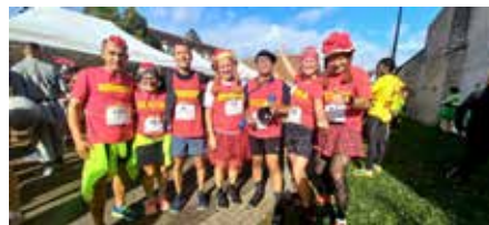
Die Genussläufer beim Genussmarathon von Chablis

Als einzige deutsche Veranstaltung ist der Genusslauf in die Laufserie „Challenge de la convivialité“ international eingebunden. Hier sind 21 genussbetonte Breitensportereignisse (alle übrigen meist in Wein- oder Genussregionen in Frankreich und Belgien) mit teils weltweiter Anziehungskraft zusammengeschlossen. Allen voran der Medoc-Marathon, der von Beaujolais – beide mit fünfstelligen Teilnehmendenzahlen –, der Lauf von Cognac oder der Marathon von Chablis. Sowohl in Chablis als auch im Beaujolais trat 2023 eine Delegation der Genussläufer mit einer gutaufgelegten Gruppe an.