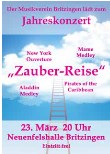
Plakat Jahreskonzert 2024 MVB

Liebe Freunde des Musikvereins Britzingen, als musikalisches Highlight haben wir uns für unser diesjähriges Jahreskonzert etwas besonderes einfallen lassen. Unter dem Titel „Zauber-Reise“ wollen wir Sie gedanklich mitnehmen an verschiedene Orte, welche gleichsam zauberhaft wie eindrucksvoll sind. Unser Konzert findet am 23. März um 20 Uhr in der Neuenfelshalle Britzingen statt und wir würden uns freuen, Sie dort begrüßen zu dürfen!